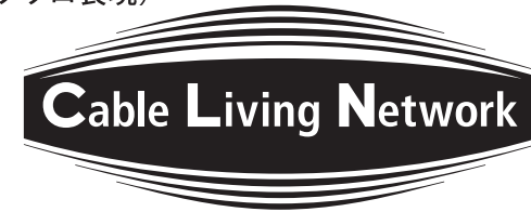
単色表示（モノクロ表現）